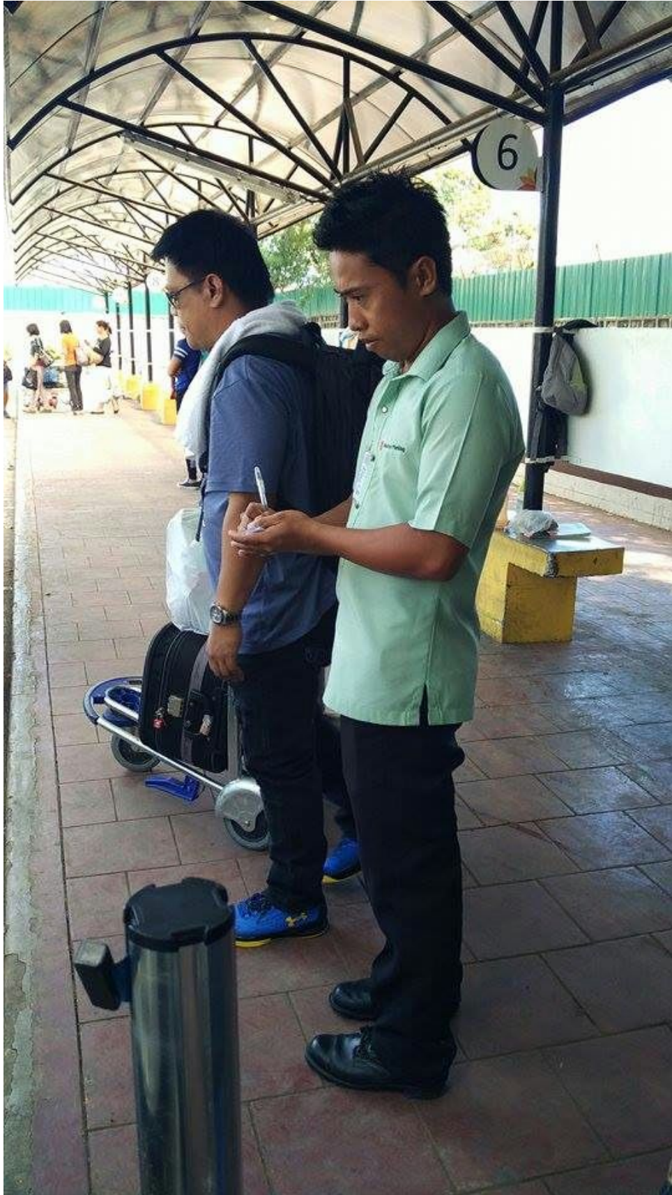
係員が紙に車のナンバーを書いて渡してくれます。