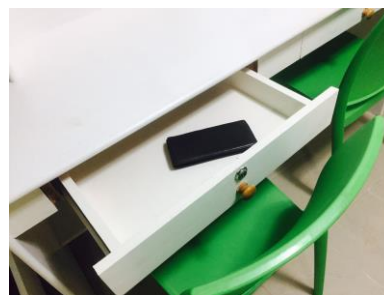
※悪い例(2) 引き出しの中