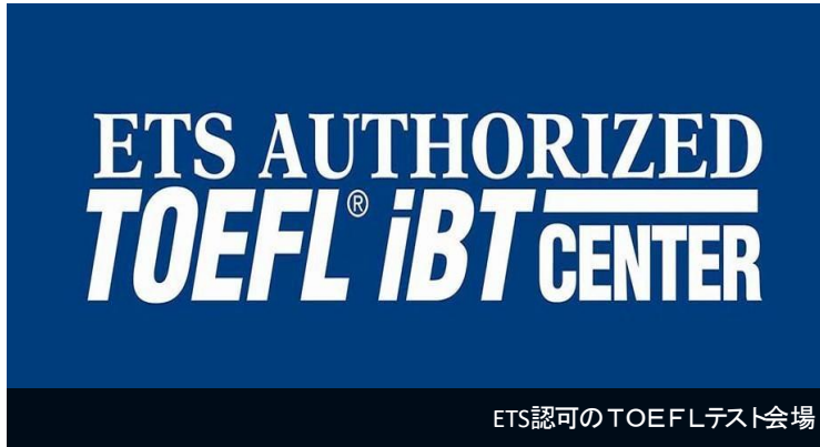
ETS認可のTOEFLテスト会場