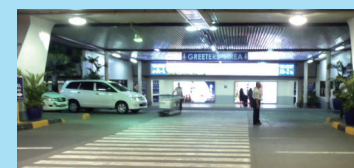
▲横断歩道を渡ると頭上に看板が見えます

空港の建物を出た後は中央の横断歩道に向かって進んでください。横断歩道の先は左の写真のようになっております。向かって右側に「M-Z」と書かれた看板がありますので、その方向へ進んでください。ゆるいカーブの下り坂を降りた所の頭上に「TUVWXYZ」の看板がございますので、その下でお待ちください。